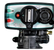
FLECK 5600 ECO