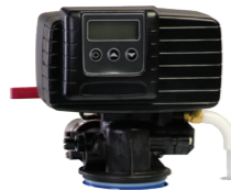
FLECK 5600 SXT

Résine Purolite C120E ou DOWEX agréée AFSSA : traitement d'eaux d'alimentation