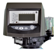
AUTOTROL LOGIX 255/760